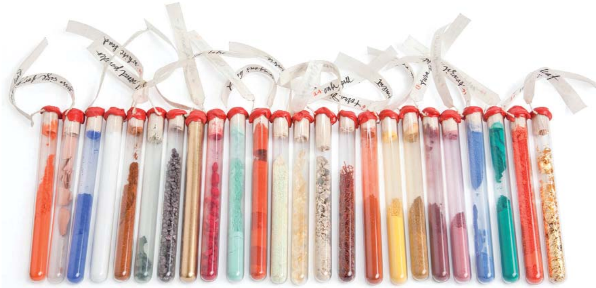
© Matthias Desmet - Cel fotografie stad Brugge

bevinden er zich al meer dan 6 miljoen boeken in de Bibliotheek – genoeg om een spoor te leggen van Brussel tot aan de kust – en daar komen er nog elk jaar heel wat bij!