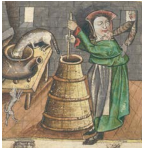
Boek van de gewone geneesmiddelen , Zuidelijke Nederlanden, 15de eeuw (ms. IV 1024, fol. 30v); nr. 25