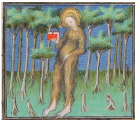
Jacobus de Voragine, Legenda aurea , Frankrijk, begin 15de eeuw (ms. 9228, fol. 48v); nr. 38

We vinden er sibillen, zieneressen en tovenaressen naast Bijbelse profeten (nr. 15, 25). Heiligenlevens tonen de moed en het martelaarschap van vrouwen die weigeren in het huwelijk te treden, kracht bijgezet door soms spectaculaire magische episodes zoals het plotse verschijnen van reddende haargroei (nr. 2, 3, 32). De Maagd Maria, belichaming van de moeder (nr. 5, 34), wordt ook voorgesteld als een godin die lactatie heeft als superkracht (nr. 33) of als een vrouwelijke krijger die de duivel verslaat (nr. 34). In de literatuur worden de antieke meesteressen van de kunst van de wonderdrankjes, zoals Circe en Medea, nu eens opgehemeld en dan weer neergehaald (nr. 31). Of ze nu helse of hemelse godheden zijn (nr. 28), hun macht wordt weerspiegeld in de mythe.