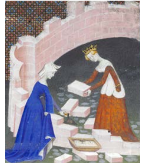
Christine de Pizan, De Stad der Vrouwen , Frankrijk (Parijs), begin 15de eeuw (ms 9393, fol. 2v-3r); nr. 28

D e tentoongestelde werken richten de schijnwerpers op prachtige, sterke, gecultiveerde, onverwachte of jammerlijk vergeten vrouwen. Ze leefden in de Zuidelijke Nederlanden tot ze werden verzwoegen door de vloedgolf van beschuldigingen en processen. Als vele facetten van een breed spectrum leven ze in gemeenschappen binnen de begijnhoven (nr. 1), werken ze, genieten ze relatieve onafhankelijkheid (nr. 4, 40) en dragen ze als mecenasen bij tot de bloei van allerhande kunstvormen. Ze nemen de wapens op en weigeren een secundaire rol te spelen op het politieke schaakbord (nr. 8, 9, 10, 11, 23, 35). Ze bezitten onbetwistbare ancestrale kennis en genieten gezag op geneeskundig vlak als genezeressen en vroedvrouwen (nr. 13, 16, 17). Ze bestellen, lezen en verzamelen verlichte handschriften (nr. 6, 7, 15, 18, 19, 20). Ze houden zelf ook pen of penseel vast (nr. 4 en 6). Weliswaar genoten niet alle vrouwen deze privileges op gelijke wijze;