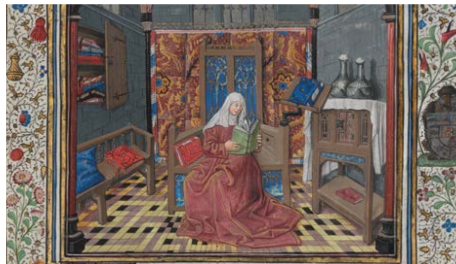
Christine de Pizan, De Stad der Vrouwen , Zuidelijke Nederlanden, 1460-70 (ms. 9235-37, fol. 3r); nr. 14

De spanning rond de rol en de status van vrouwen is zo groot dat ze aanleiding geeft tot het eerste geschreven literair debat in de Franstalige geschiedenis, over de waarden die worden beschreven in de beroemde ‘Roman de la Rose’ (nr. 23). Aan dit ‘debat van de vrouwen’ (Querelle des femmes) nemen geestelijken, schrijvers en intellectuelen deel. Aan het hoofd van de ‘Champions’ van de vrouwen staat de schrijfster Christine de Pizan, die het in haar hele oeuvre opneemt voor de vrouw en zich opwerpt als verdedigster van haar deugden en haar plaats in de wereld, en positie inneemt tegen de heersende misogynie (nr. 14, 23, 28, 33, 35).