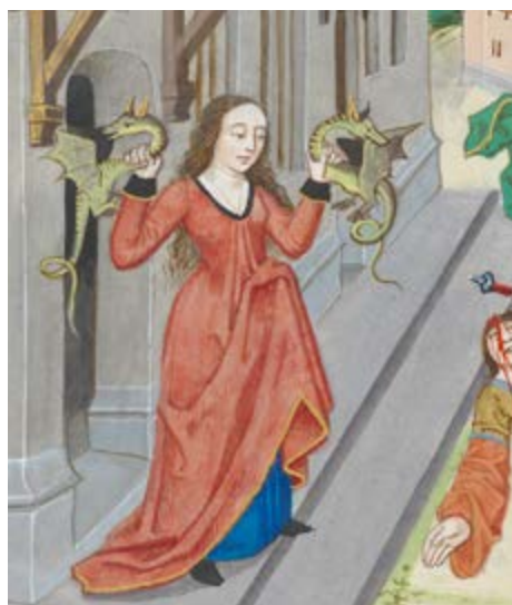
Christine de Pizan, De brief van Othéa , Zuidelijke Nederlanden (Rijsel), ca. 1460 (ms 9392, fol. 20v); nr. 29

V oorbeelden van misogynie zijn er in overvloed. Vrouwen – die bespot en gestraft worden – vertolken een hoofdrol in vele episodes van de ‘Cent nouvelles nouvelles’ (nr. 21). Behaard en woest krijgen ze een dierlijk uiterlijk in de verhalen waarin volkeren uit het Oosten worden opgevoerd (nr. 22). Hun naakte lichamen verraden een blik die onderwerpt, instrumenteert en domineert. De tragische levensloop van heldinnen in volksverhalen, zoals de mooie Helena van Constantinopel (nr. 28), toont hoezeer het patriarchaat zijn wil oplegt aan het lichaam en het leven van vrouwen.